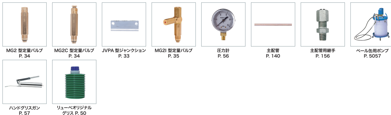
MG2 型定量バルブ P. 34