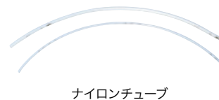
ナイロンチューブ